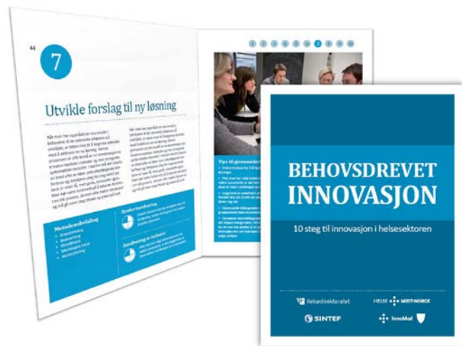
Kunnskapsutvikling og formidling